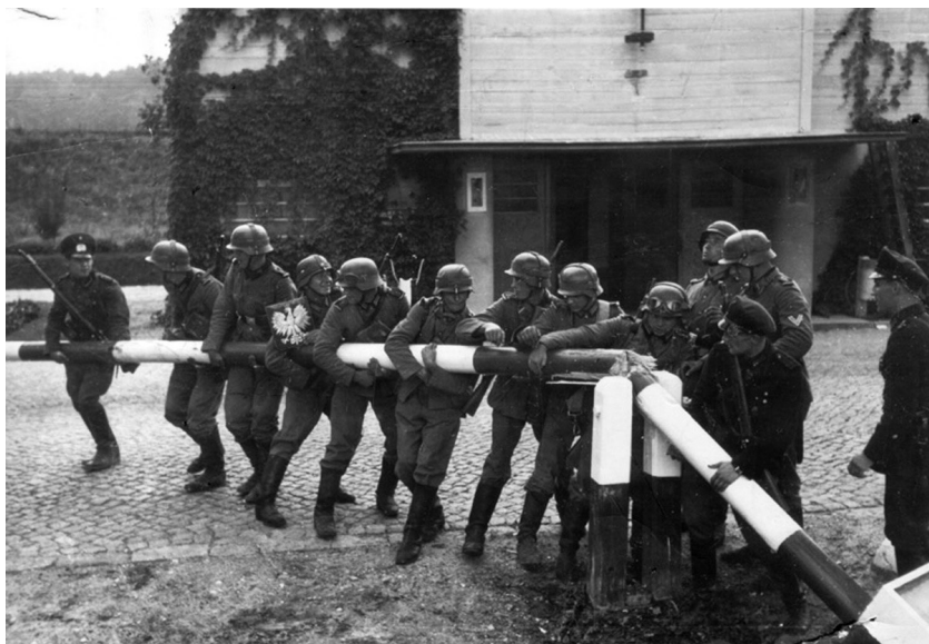
Немското нахлуване в Полша.

Москва признава генерал Шарл дьо Гол, главата на Френския национален комитет, представител на „Сражаваща се Франция“ (казионно политическо движение на френската емиграция във Великобритания по време на Втората световна война. Тя е в опозиция на колаборационистката и антисемитска Вишистка Франция).