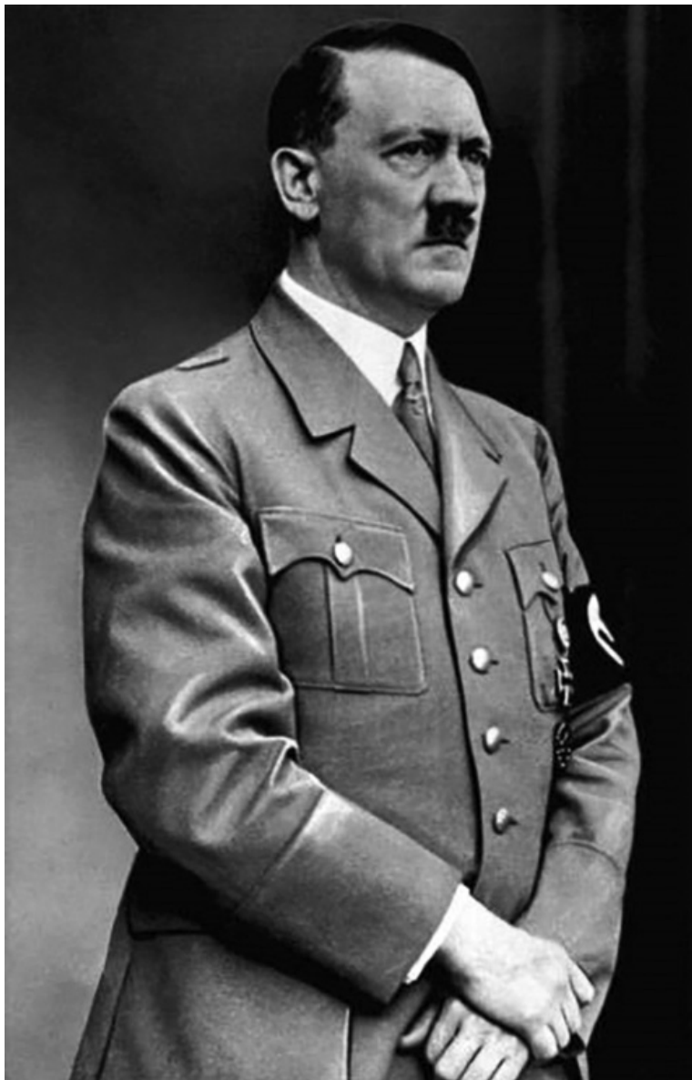
Адольф Хитлер 1937 г.