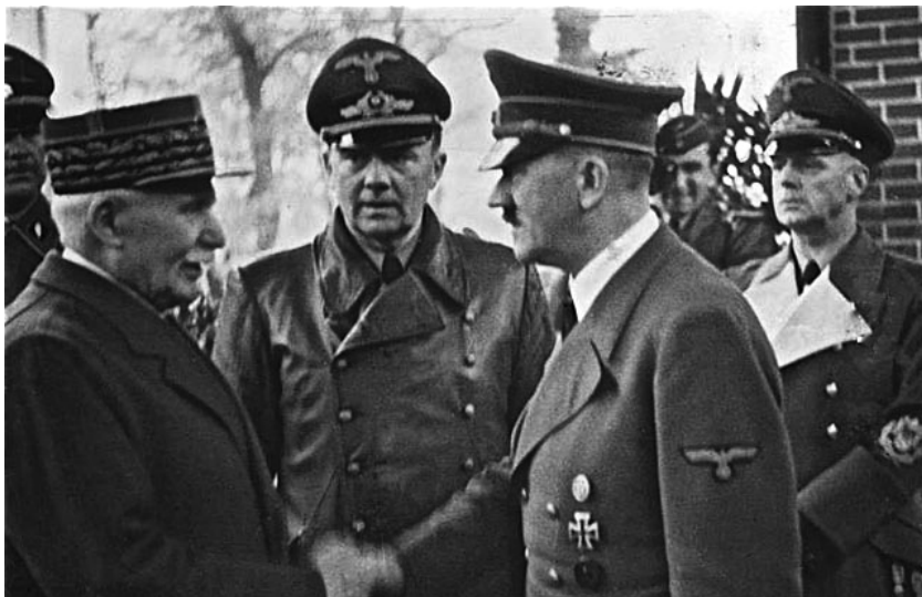
Маршал Анри Филип Петен посреща Адолф Хитлер в Монтуар-сюр-ле-Лоар на 24 октомври 1940 г.

само три и половина милиарда, британската промишленост произвежда дванадесет пъти повече бронирани автомобили, повече бойни кораби, танкове и артилерийски оръдия.