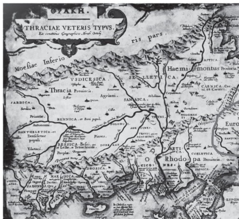
Европа като провинция върху картата на Тракия от 1570 г. на нидерландския картограф Абрахам Ортелиус

Но дали е така? Защо дори през 1585 година Европа е показана като провинция в утробата на Тракия върху картата на Абрахам Ортелиус?