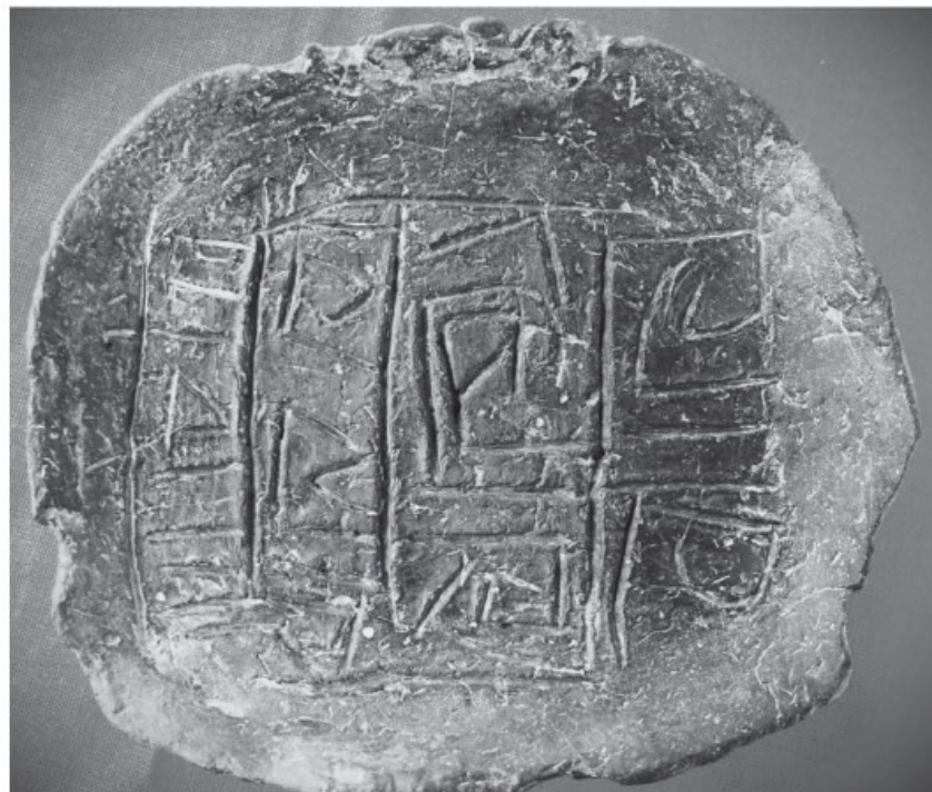
Текстът за посветени върху двустранно гравирана обредна керамична плочка с писмена от V хил. пр. Хр., открита в с. Градешница

Територията на днешна България е Земя на свещените писмена поне от V хил. пр. Хр. Оттогава са глинените и каменните плочки с най-старите дълги записи, които са с хилядолетие по-древни дори от египетските протоиероглифи! Върху археологически находки от долното течение на Дунав са открити към 5500 знака от епохата на неолита (около 6000 до 3500 г. пр. Хр.), като в над 1000 от случаите те са комбинирани от 2 и повече символа. Глинени плочки със сакрални символи са намерени и до вече споменатото село Караново (което е почти в средата на Одриското царство), сред руините на свещения за траките Перперек в земите на бесите край днешния град Кърджали. А положително ще видим още, след като се научихме да ги забелязваме.