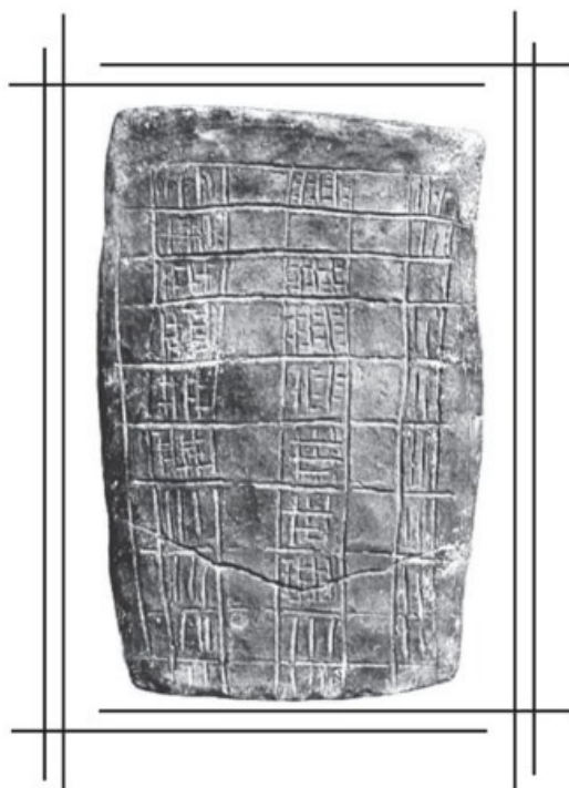
Пространен дъвен документ от V хил. пр. Хр. върху керамична плочка от с. Слатино, Кюстендилско, с козарнишкия начин на записване

Нашите цивилизатори на Европа не изоставяли и прадревния си начин за записване „с черти и резки“ от западнобългарската пещера Козарника. Освен като врязани отделни знаци по скалните светилища ги имаме подредени в дълги редове като на пространен дъвен документ. Той е врязан върху дъното на керамичен модел с вид на пещ от V хил. пр. Хр., намерен под останките на четири селища от неолита и каменно-медната епоха близо до кюстендилското село Слатино. Изследователи предполагат, че това може да е календарна система, защото някои от откритите там предмети издават астрономическите познания на енеолитните хора.