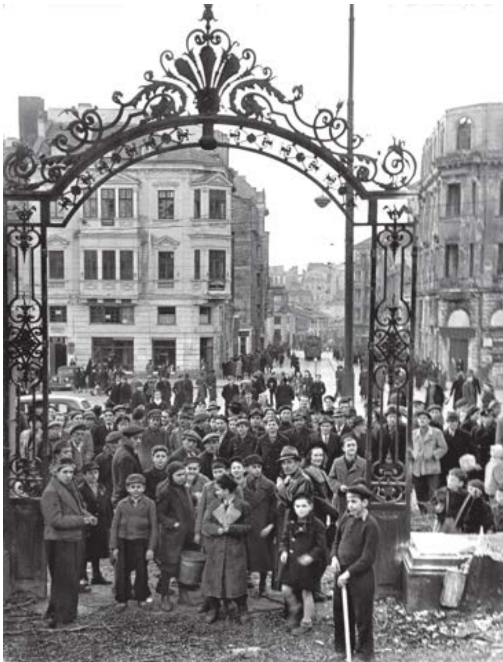
◀ Разрушаване на оградата на Двореца