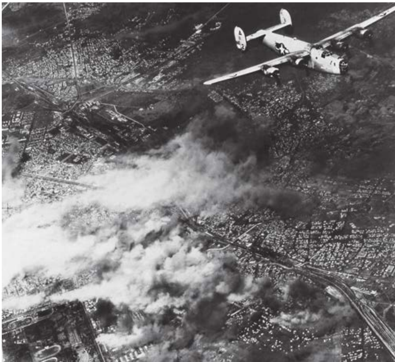
Бомбардировката на София на 30 март 1944 г., заснета от борда на американски самолет, хвърлени са над 3000 разрушителни бомби от 250 до 1500 кг.