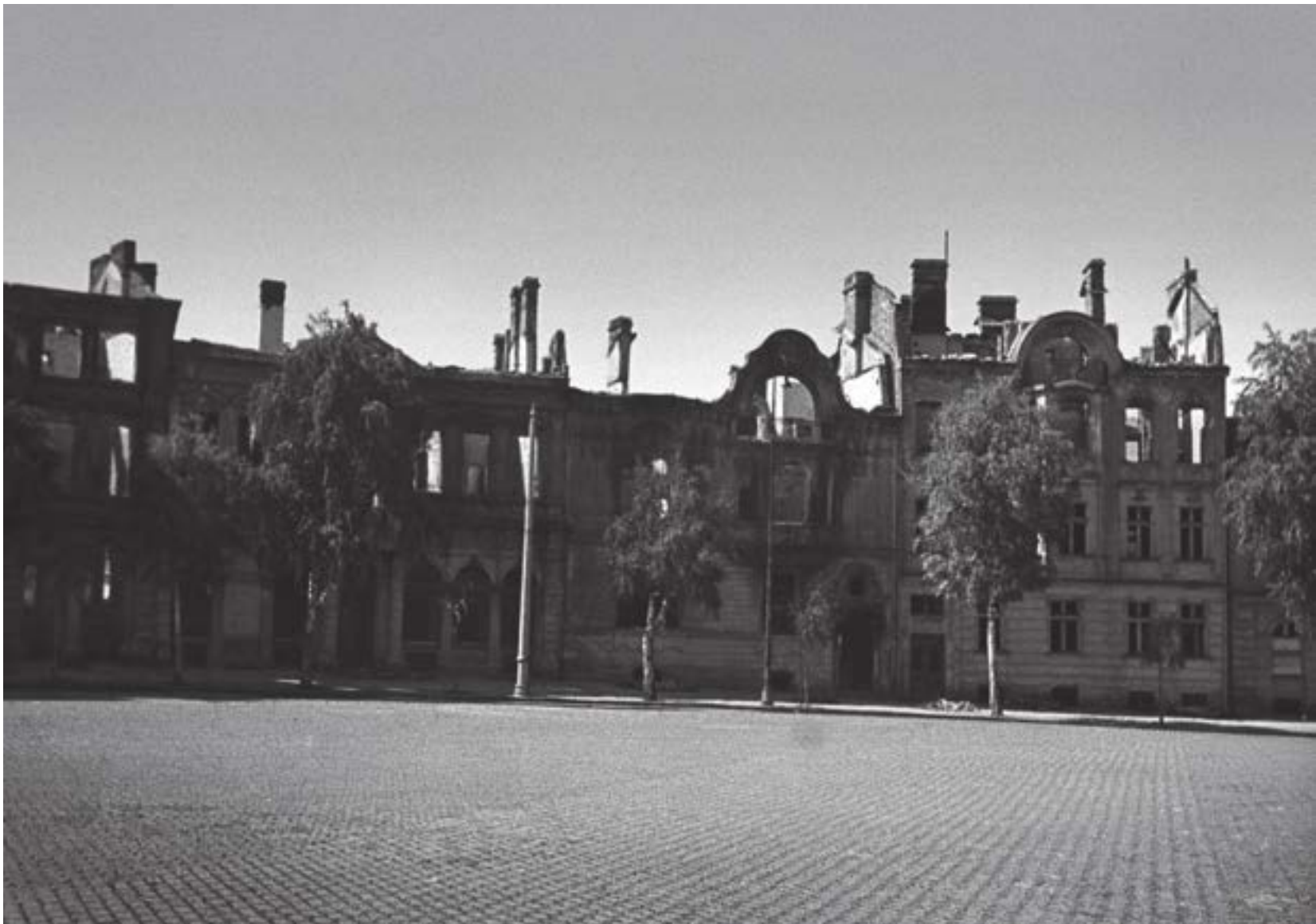
Сградите на мястото на днешния хотел „Радисън“