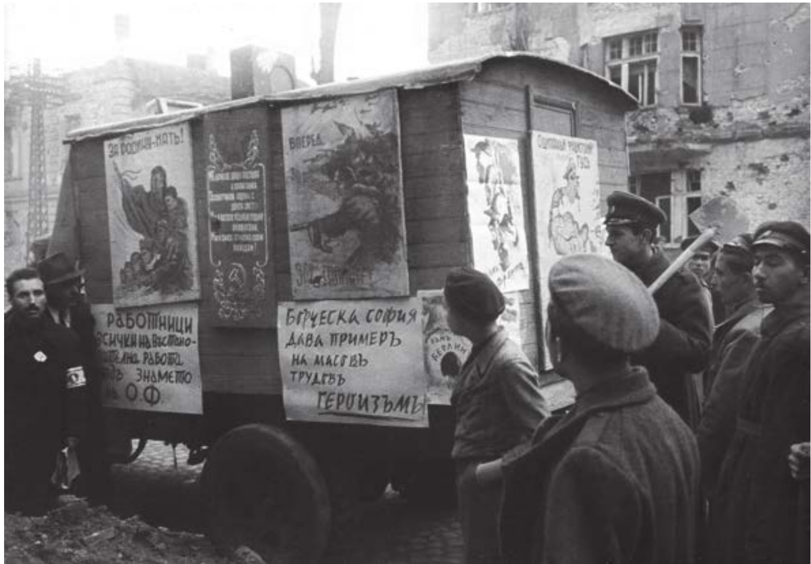
Бул. „Маршал Феодор Толбухин“ („Васил Левски“) и ул. „Юрий Венелин“