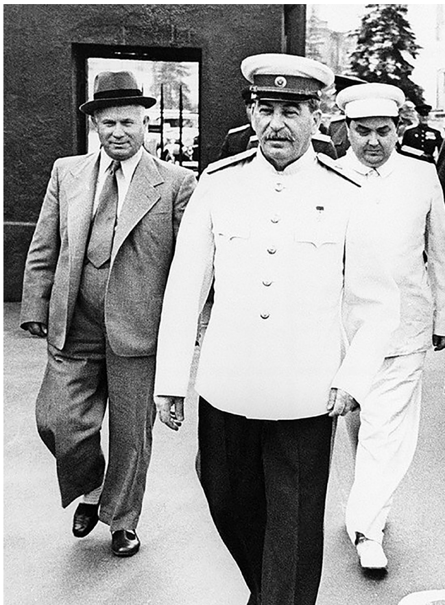
Хрущов е един от най-преданите сподвижници на Сталин