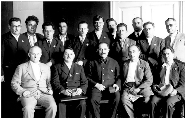
Областните партийни ръководители през 1935г. На първия ред седят Никита Хрущов (Москва), Андрей Жданов (Ленинград), Лазар Каганович (Украйна), Лаврентий Берия (Грузия) и Нестор Лакоба (Абхазия).

случай завършването на строителството на първата линия на московското метро Хрущов бил награден с орден Ленин – първия орден в живота му.