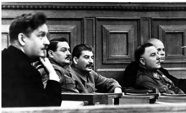
Депутатите във Върховния съвет на СССР Николай Булганин, Андрей Жданов, Йосиф Сталин, Климент Ворошилов, Никита Хрушчов, 30-те години.

от него, от неговата любезност, внимание, осведоменост, грижа, обаяние и искрено му се възхищавах“.