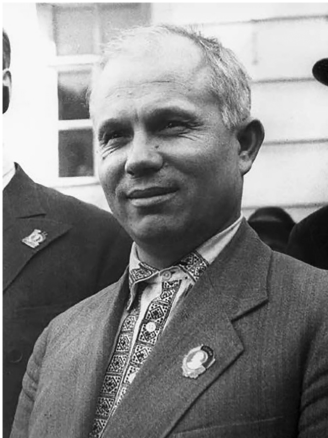
Никита Хрущов в Москва, 1935 г.