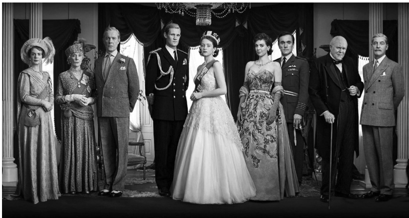
Кадър от телевизионния сериал „Корона“

1483–1485 година, е предаден от един от своите най-близки сподвижници – херцог Бъкингам, който прави планове за свалянето му, за да премине властта в ръцете на младия Хен-ри Тюдор от Ланкастърите. В битката при Босуърт през август 1485 година Ричард III е убит, което слага край на Плантагенетите по мъжка линия. Короната, свалена от мъртвия Ричард III, направо на бойното поле си слага на главата Хен-ри Тюдор, влязъл в историята под името Хенри VII от династията на Тюдорите . В герба на тази династия най-накрая Червената и Бялата роза се обединяват, образувайки розата на Тюдорите. Тяхното управление се превръща в истински ренесанс за Англия – тя става една от водещите европейски държави. Епохата на Тюдорите свършва през XVII век, когато наследник на бездетната Елизабет I става шотландският крал Джеймс VI от династията Стюарт . В историята на британската монархия той влиза под името Джеймс I.