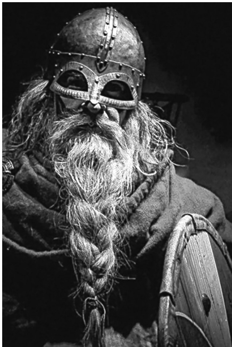
Викинг. Реконструкция. Норвегия. Восъчната фигура, облеклото, оръжията и накитите са изработени въз основа на археологически находки, изобразителни и писмени източници от времето на викингите.