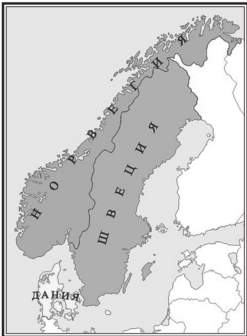
Съвременна карта на Скандинавия