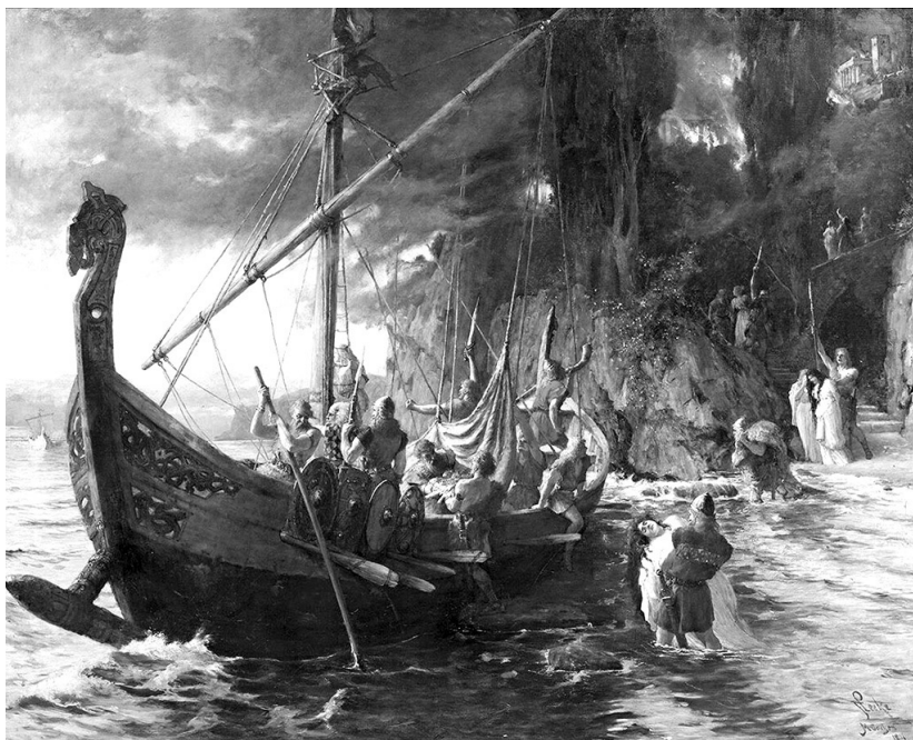
Фердинанд Лике. „Набег на викинги“, 1906 г.

Викинги – така наричали онези, които вече нямали дом на брега, а само кораб. Учените все още спорят какво точно означава „викинг“. Едни казват, че това е просто „обитател на залив“, защото „вик“ означава „залив“*. Други твърдят, че „викингът“ е по-скоро „човек, нападащ жителите на залив“. Трети извличат тази дума от името на древната провинция Вик в Южна Норвегия, в близост до съвременния град Осло. Четвъртите доказват, че „викинг“ не се е наричал човек, а пътуването на кораб, на което се е отправил той. Една и съща фраза от древен документ се превежда и като „той тръгнал с викингите отвъд морето“,