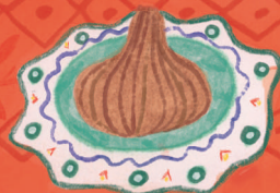
Сир Чесънят се слага за добро здраве.