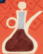
Серкех Оцет – символ на търпението и зрелостта.