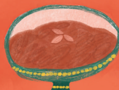
Саману Пудинг от пшеница, който символизира сладостта на живота.