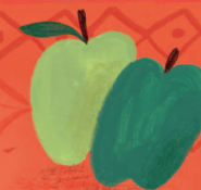
Сиб Ябълката е символ на здравето и красотата.

На масата се слагат и аквариум със златни рибки – символ на живота; свещи, символизиращи светлината и щастието, както и стихосбирка на персийския поет Хафез. Тук е и Коранът.