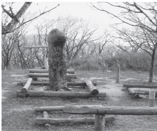
Капище 2 на славянския бог Перун

Именно така рисуват живота на нашите предци историците и археолозите, изследователите на религията и културата, етнографите и представителите на всевъзможни науки, свързани по един или друг начин с историята на човека и обществото.