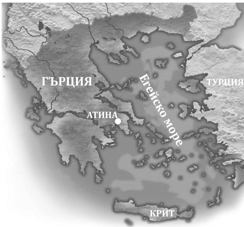
Територията на Гърция

Балканският полуостров е разделен на няколко части от заливи, свързани помежду си с тесни провлаци. На изток от него се отделят много острови, а на юг в морето се намира остров Кандия (Крит). По планинските склонове растат грозде, ориз и плодове, южните долини са пълни с портокалови, лаврови и маслинови горички. Край морските брегове и в реките гъмжи от риба.