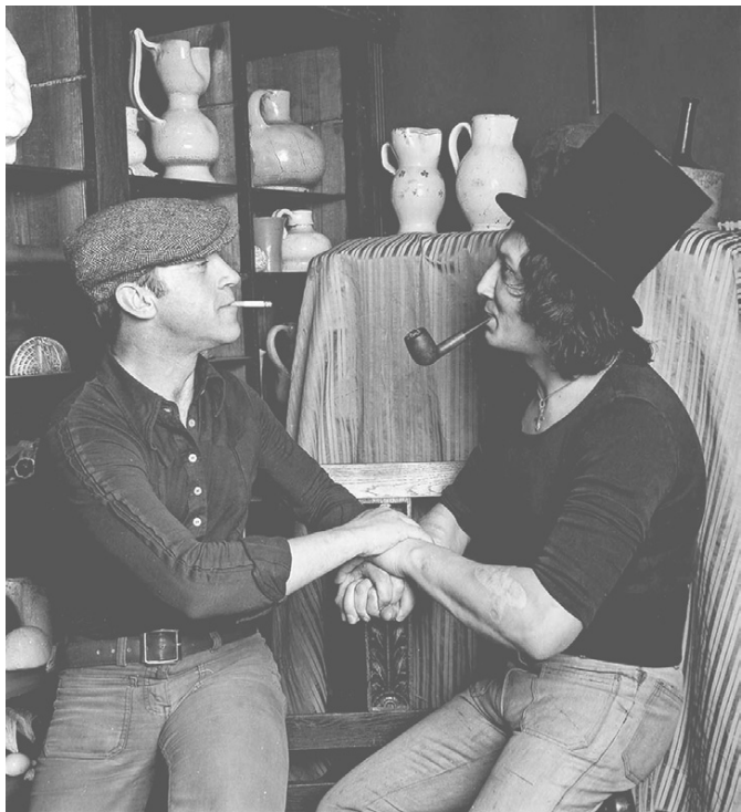
Владимир Висоцкий и Михаил Шемякин. Париж, ателье на М. Шемякин, август 1978 година.