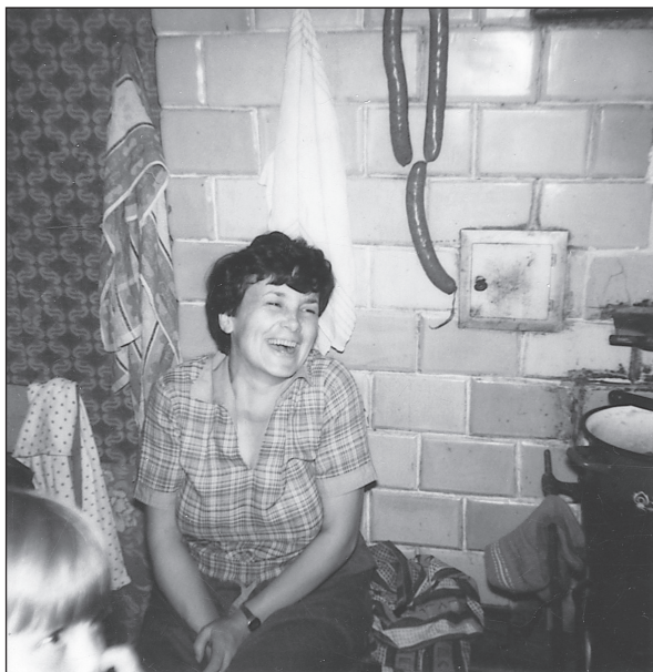
В родния ми дом в Крипи. Средата на осемдесетте години

че. Мечтаех. Не исках да имам такъв тежък живот като този на моите родители. Мечтаех за добър съпруг, деца, за собствен дом. Толкова малко и толкова много! Мислех си, че за да създам свой собствен живот, своя среда и собствено гнездо, трябва да се изнеса от това място и да си намеря ново.